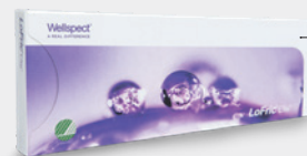
Boite d'échantillons, 5 unités.

*Longueur utile : longueur de la sonde pouvant être insérée dans le corps.